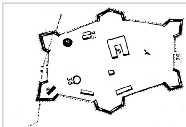
Фортеция с плана М. Витвера

Но главное, обращаясь к карте Петровской слободы (топоним, появившийся в XIX в.), исследователи способны реконструировать инженерное своеобразие и артиллерийскую боеготовность петровской «фортеции». Согласно «ленд-карте», артиллерийские орудия, подобно Петербургской крепости на Неве, были расставлены так, чтобы держать местность и береговое пространство под перекрестным обстрелом. Ниже экспликации и 3-саженной масштаб-