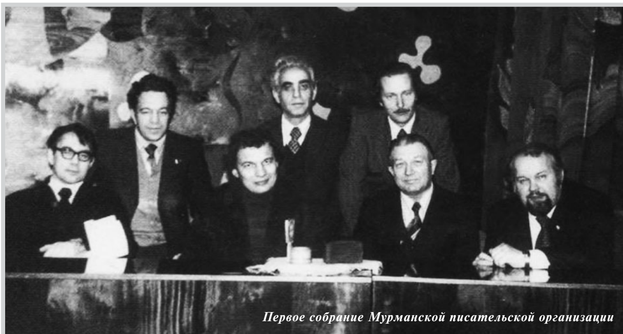
Первое собрание Мурманской писательской организации