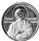
медаль Александра Невского