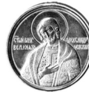
медаль Александра Невского