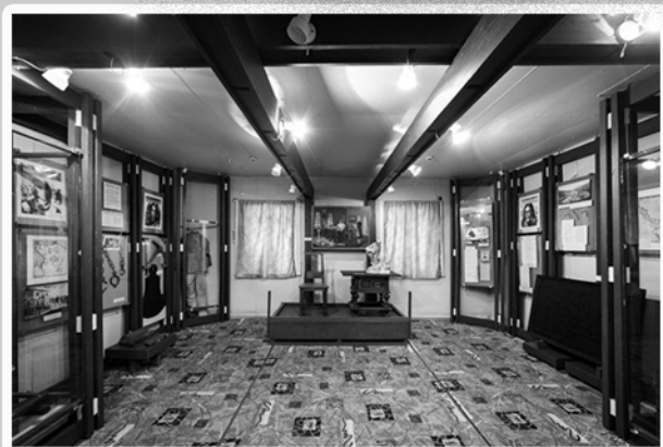
Филиал Национального музея РК на Марциальных водах