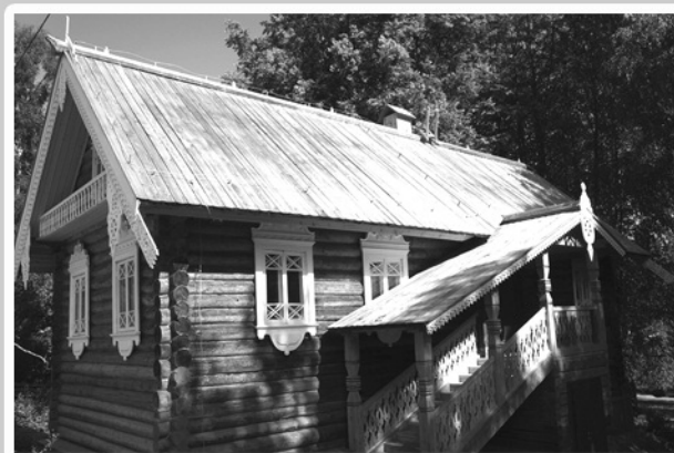
Дом смотрителя на Марциальных водах