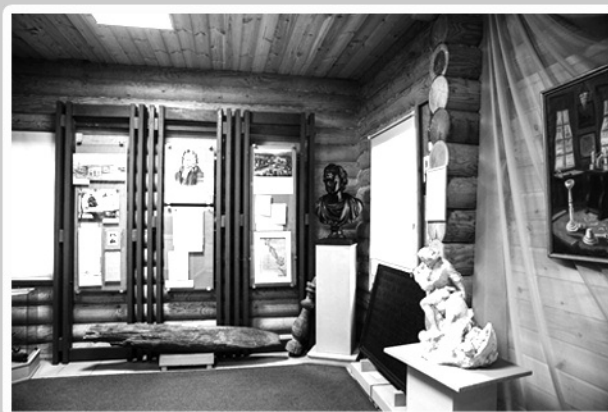
Экспозиция Дома смотрителя на Марциальных водах