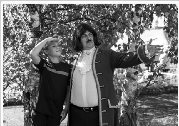
Государство новое создаем