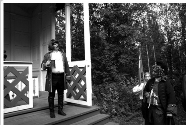
Петров день на Марциальных водах