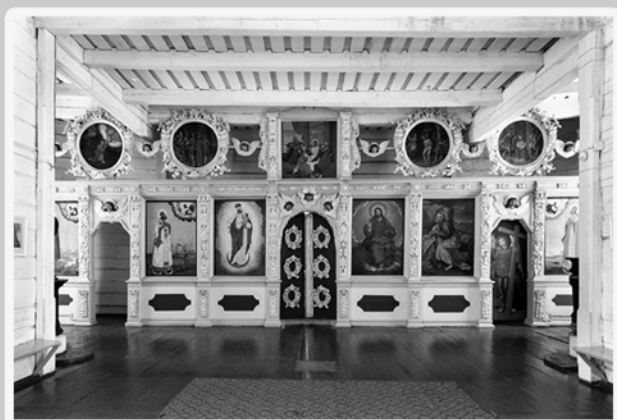
Иконостас церкви апостола Петра на Марциальных водах