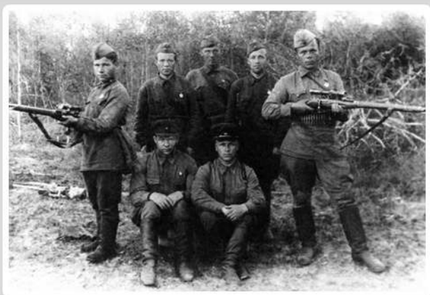
Группа бойцов и офицеров, г. Воткинск, Ижевск. Июль 1941 г.