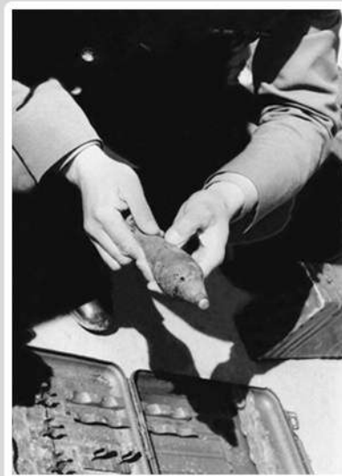
Находки на рубеже обороны 313-й СД. Экспедиция музея 1989 г. Фото М. Ю. Данкова