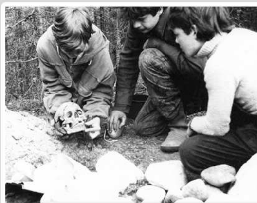
Воспитанники группы «Поиск» рассматривают находки. Экспедиция. М.Ю. Данков. 1989 г.