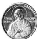
медаль Александра Невского